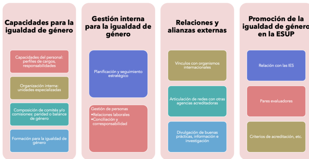
Diagrama 1: Dimensiones para la igualdad de género en las agencias acreditadoras (Sello SIACES Género)

Se propone que las cuatro dimensiones se articulen en torno a la primera, esto es capacidades para la igualdad de género como la dimensión base que permite el avance en las otras tres dimensiones. Se fundamenta en que las capacidades para la igualdad de género permiten la transversalización del enfoque de género en los distintos ámbitos del quehacer de las agencias, esto es su gestión interna, sus relaciones y alianzas externas, y su rol en la promoción de la igualdad de género en los marcos de aseguramiento de la calidad de la Educación Superior.